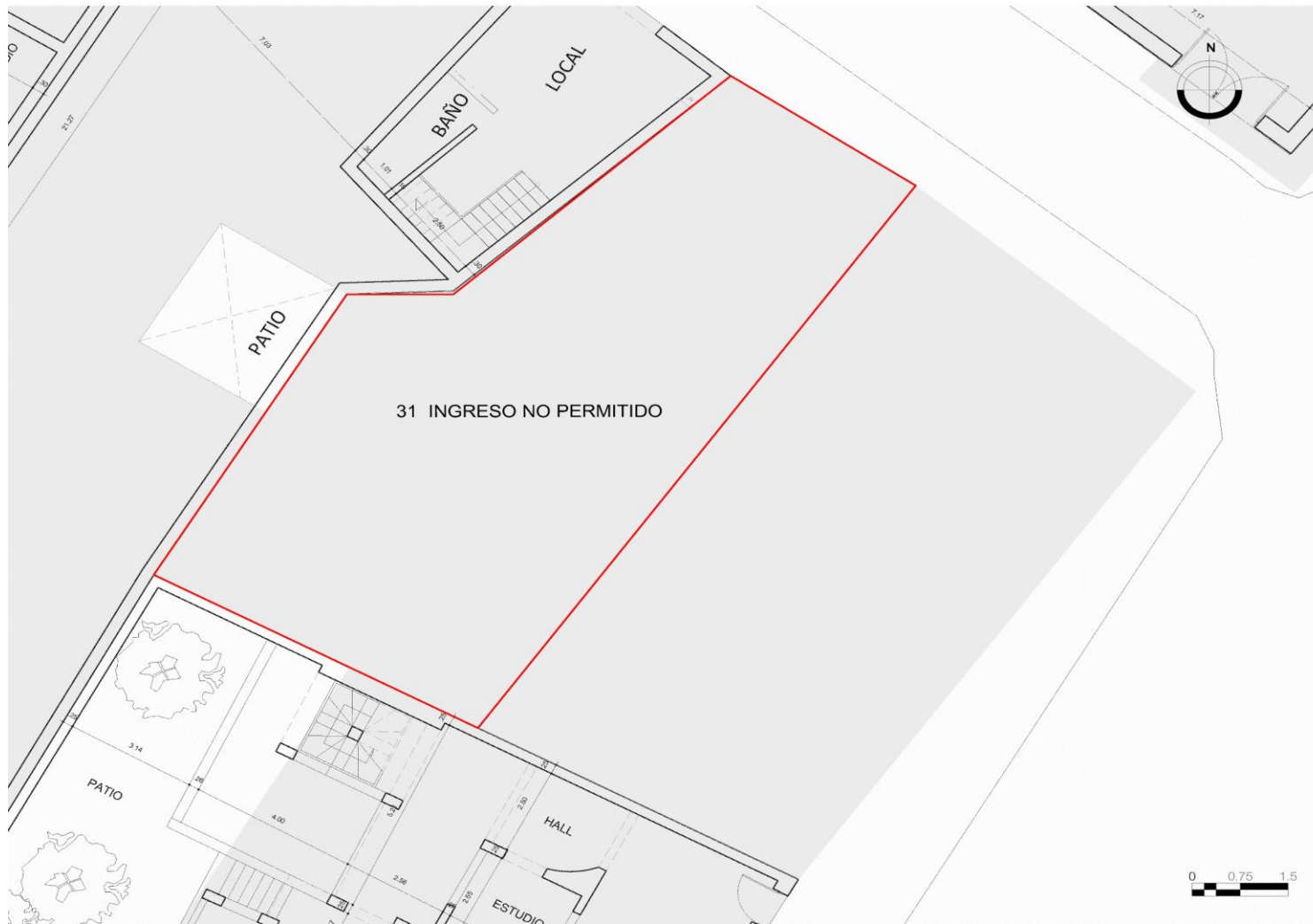
Planta primer piso